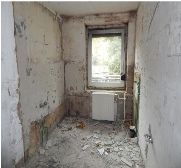
Bad im aktuellem Zustand