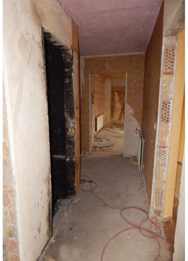
Flur im aktuellem Zustand

Mehr Informationen auf der Homepage: https://prieschka.badliebenwerda.de/__trashed/