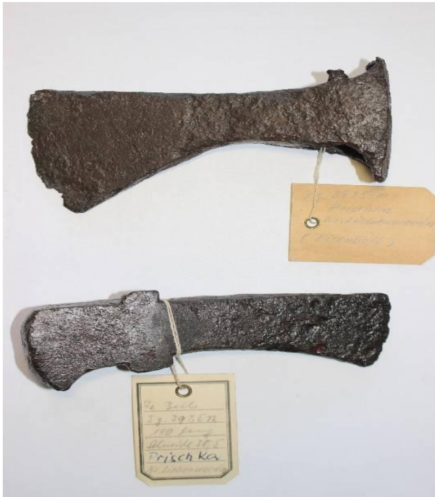
Funde der Kaiserzeit, Äxte

7 Pfeilspitzen, 2 Äxte, 2 Messer, 2 Schwerter, ein Schildbuckel und die dazugehörige Schildfessel, 2 Sporen, Bruchstücke von 3 Speeren, Eimerhenkel und die Eisenteile vom Schloss einer Holztruhe. Einige Eisenwaffen zeigen Einlagen von Edelmetall. Die Fundsachen befinden sich im Museum für Vor- und Frühgeschichte in Berlin. In den Gräbern welche von Voegler freigelegt wurden befanden sich folgende Gegenstände.