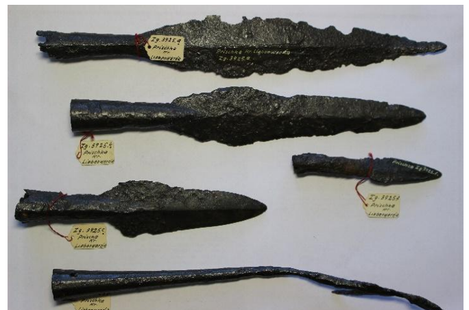
Funde der Kaiserzeit, Lanzen spitzen