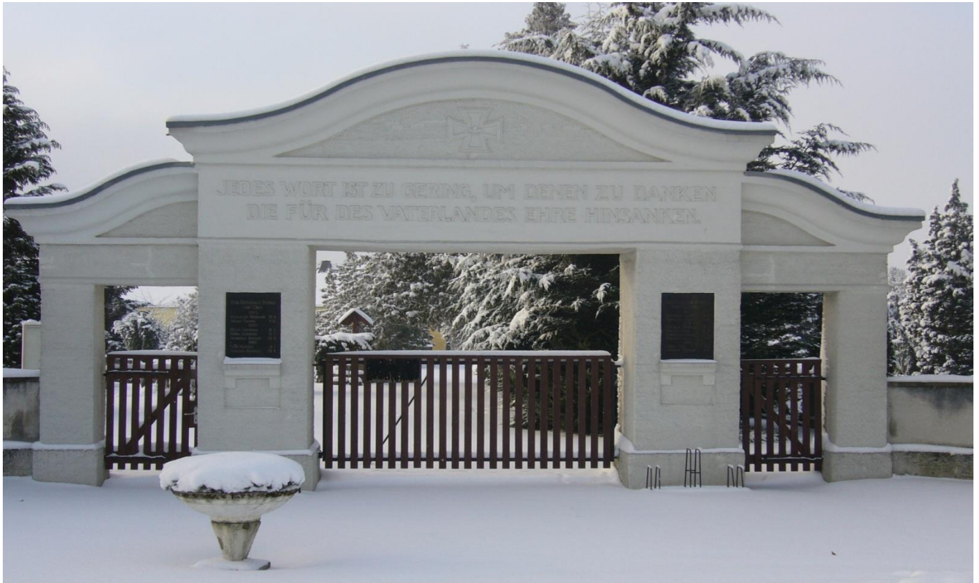
Friedhofstor im Januar 2009