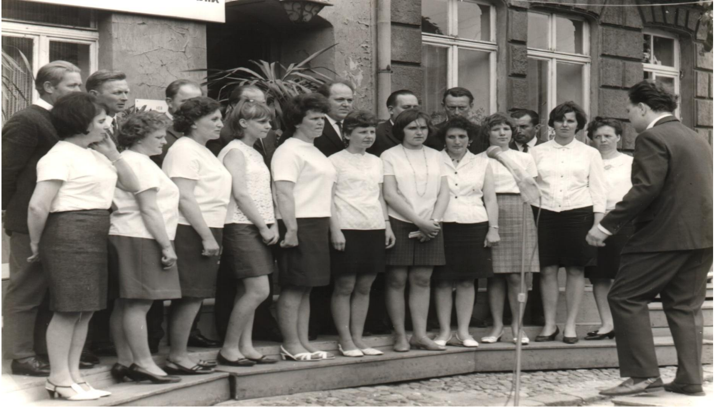
Gemischter Chor 1969