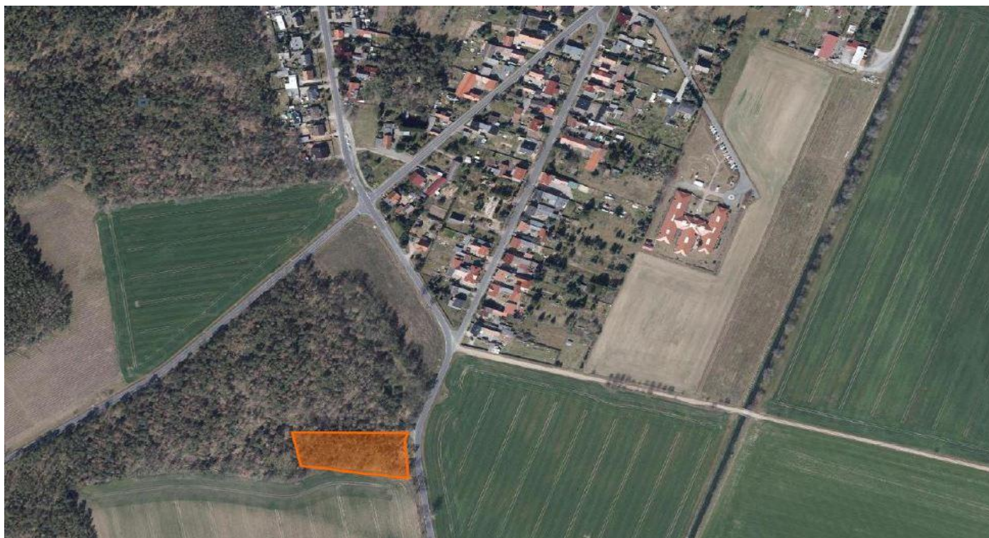
Standort des geplanten Mobilfunkturmes

Mit Datum vom 26.01.2024 ist bei der Verbandsgemeinde Liebenwerda für die Stadt Bad Liebenwerda ein Bauantrag zur Errichtung eines Funkturms im Ortsteil Prieschka eingegangen. Der Standort des beantragten Turms wird rechte Seite Ortsausgang Richtung Reichenhain sein. Der Turm wird auf einem privatem Grundstück errichtet und eine Höhe von 50,11 m haben, von Vodafone betrieben werden und mit einem Stabmattenzaun in Höhe von 2,00 Meter eingefriedet werden. Die anderen Telekommunikationsunternehmen Deutsche Telekom und O2 werden ebenfalls Antennen auf diesen Mast anbringen. Der Antragsteller sieht vor 10 Antennen zu installieren.