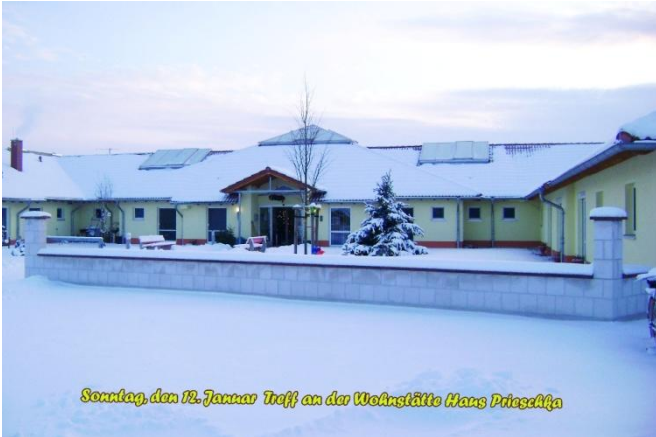
Sonntag, den 12. Januar Treff an der Wohnstätte Haus Prieschka

Die ruhig und herrlich im Grünen gelegene Wohnstätte „Haus Prieschka“ bietet für 40 Bewohnerinnen und Bewohner Sicherheit und Ruhe gleichermaßen, ohne jedoch abgeschnitten zu sein. In der modern gehaltenen und hellen Wohnstätte selbst findet sowohl förderintensives und inklusionsorientiertes Wohnen und Leben statt, als auch die Betreuung von stark pflegeorientierten Bewohnerinnen und Bewohnern. Unser Team setzt sich zusammen aus Pflegefachkräften und Heilerziehungspflegerinnen und sorgt rund um die Uhr für das Wohl unserer Bewohner. Den förderintensiven Bewohnern werden