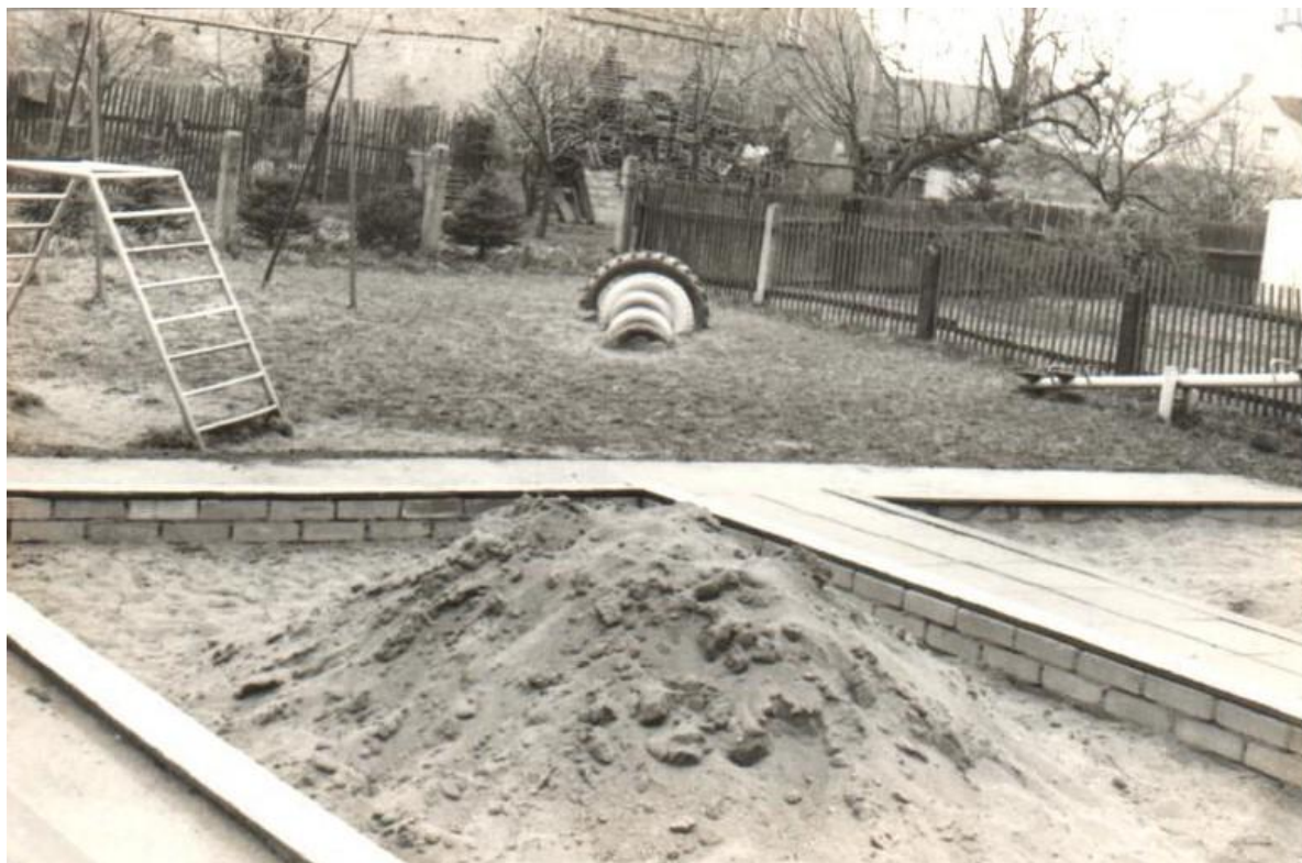
Spielplatz Kindergarten 1984